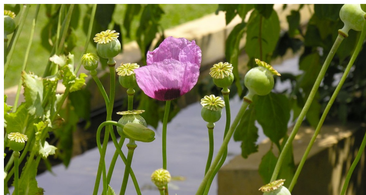
Papaver somniferum à l'éclosion