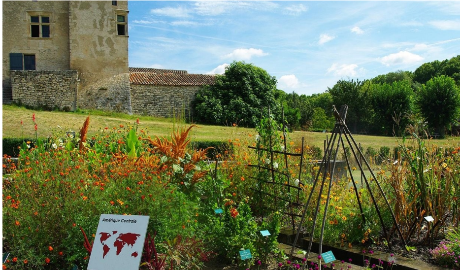
Plus de 1000 taxons sont cultivés dans le jardin des temps modernes