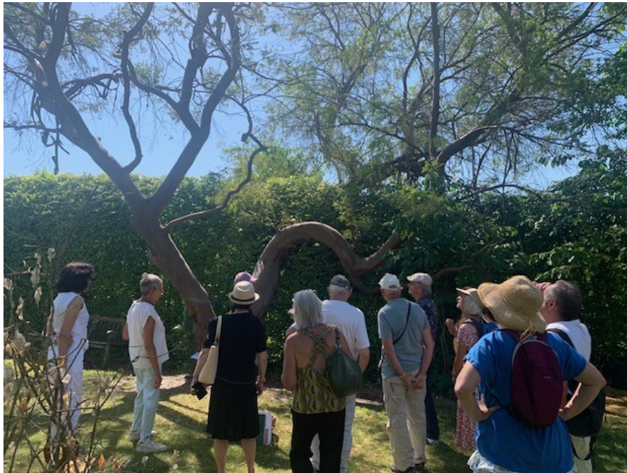
Groupe devant Eucalyptus des neiges