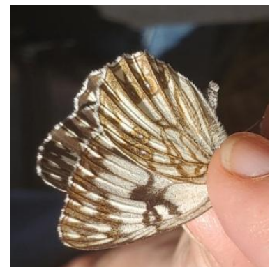
Pontia daplidice Piéride du réséda Marbré commun