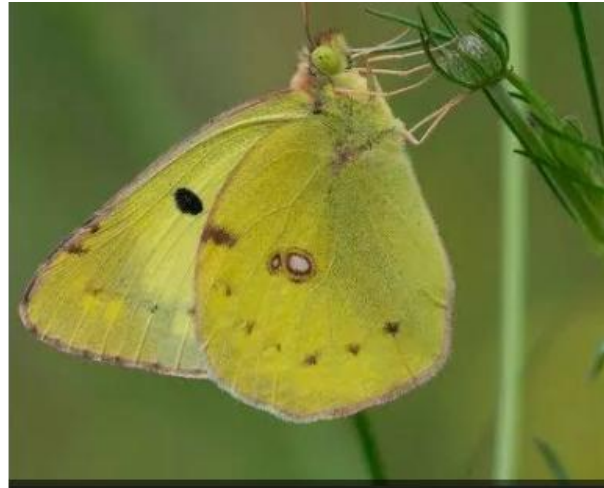
Colias alfacariensis Le fluoré