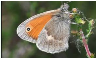
Coenonympha pamphilus Fadet