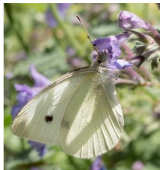
Pieris rapae Pieride de la rave