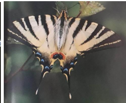
Iphiclides podalirius Flambé (le volier)