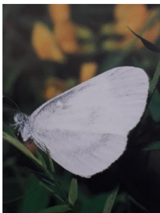
Leptidea sinapis Pieride du lotier ou de la moutarde

Par contre les papillons suivants nous ont fait gambader sans succès, impossible de les attraper .