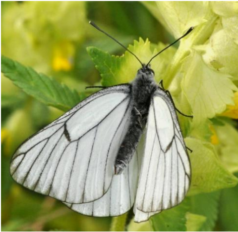
Aporia crataegi Piéride de l'aubépine – Le Gazé