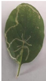
chenille (la mineuse). Le papillon mesurera 3mm.

et un peu plus loin dans un sous bois on cueille une petite feuille ornée d'un dessin tracé par une minuscule