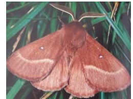
Futur Lasiocampa trifolii-Bombyx du trèfle , papillon de nuit

Dans une touffe d'herbe on trouve une chenille de Minime à bandes jaunes.