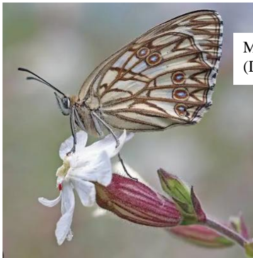
Mélanargia occitana (Demi-deuil)