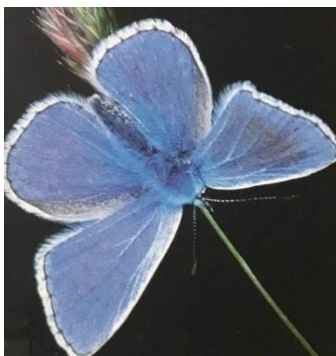
Polyommatus icarus Argus bleu