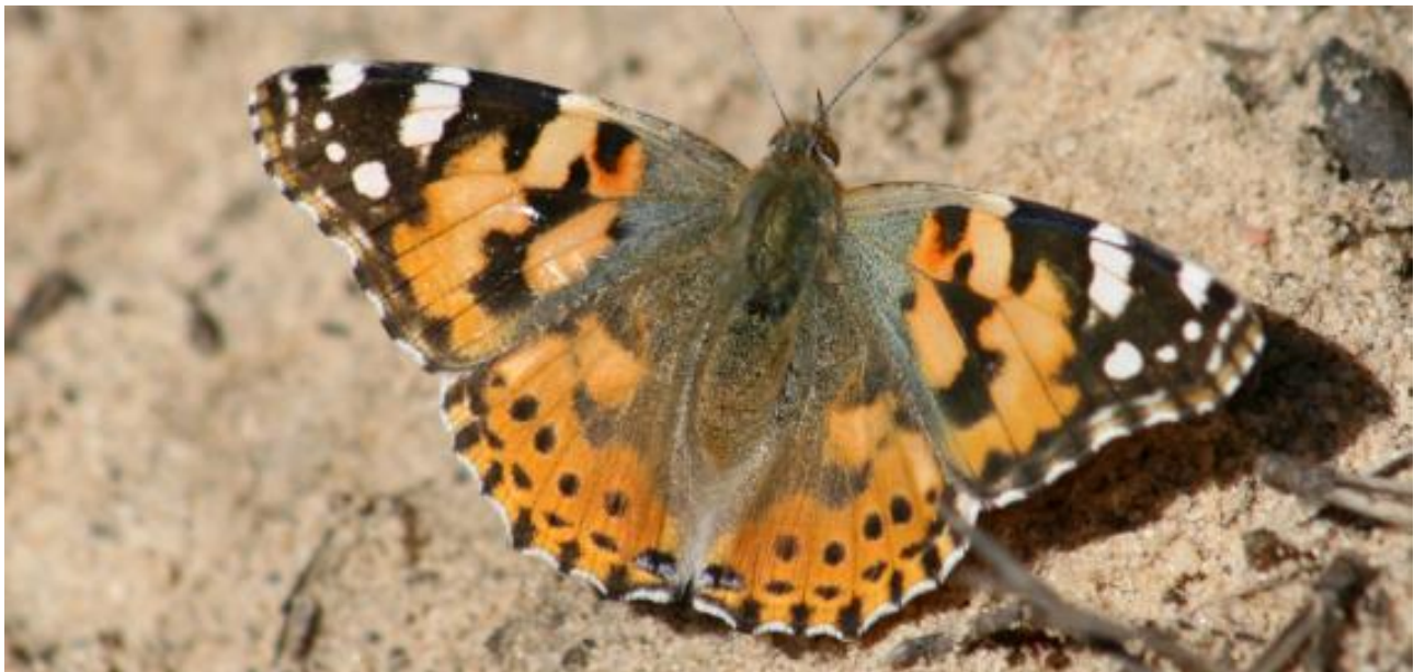
la Belle -Dame(Vanesse des chardons): Cynthia cardui

Nous continuons sur le petit chemin bordé de buissons variés et apercevons le Sylvain Azuré: Limenitis reducta , ce papillon a une jolie robe noire et blanche de soirée, il se laisse capturer photographier puis reprend son envol .