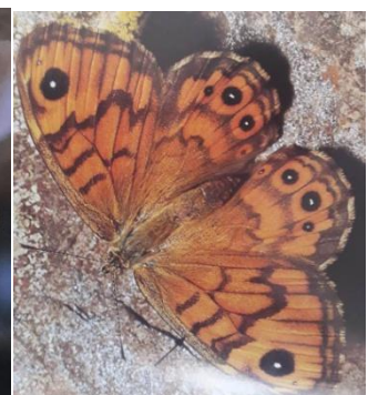
Lasiommata megera Satyre