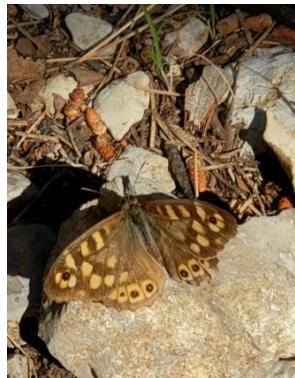
Tircis pararge aegeria