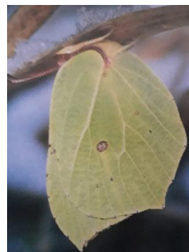
Gonepteryx Rhamni Citron