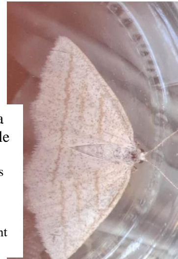
Cabera pusaria Cabère virginale

Petit papillon nocturne aux ailes blanches de la famille des géomètres. La chenille se déplace en bougeant alternativement l'avant puis l'arrière du corps