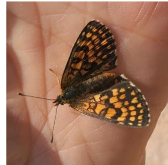
Didymaformia didyma Mélitée orangée