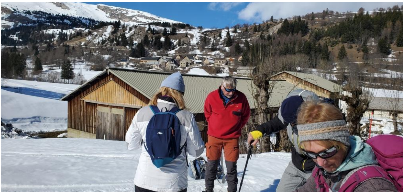
Départ de l'Enclus –