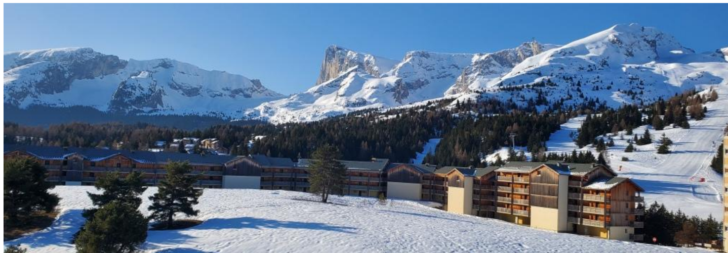
Vue sur le Pic de Bure (2709m) depuis le second étage du chalet du Dévoluy « Le chardons bleu ».