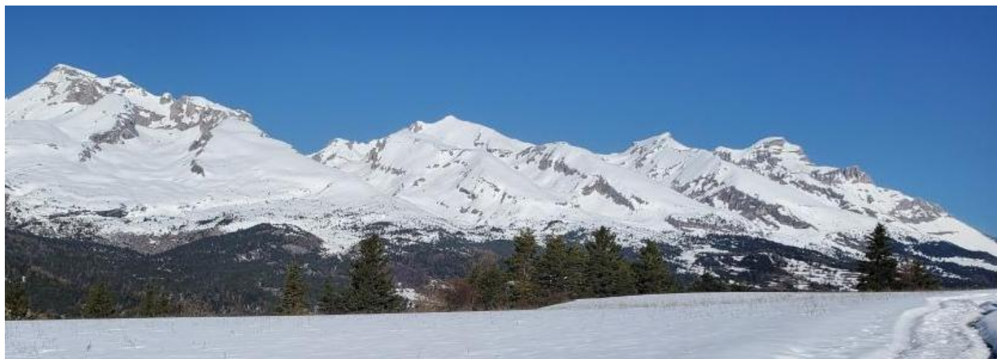
Vue depuis le col de la Joue du Loup : A gauche le Grand et Petit Ferrand (2758m) - au Centre l'Aupet (2627m). à l'extrémité droite la grosse tête de l'Obiou (2790m) point culminant du Dévoluy.

La montagne de Faraut, frontière entre Vallée du Drac et Souloise – Le Champsaur et Dévoluy