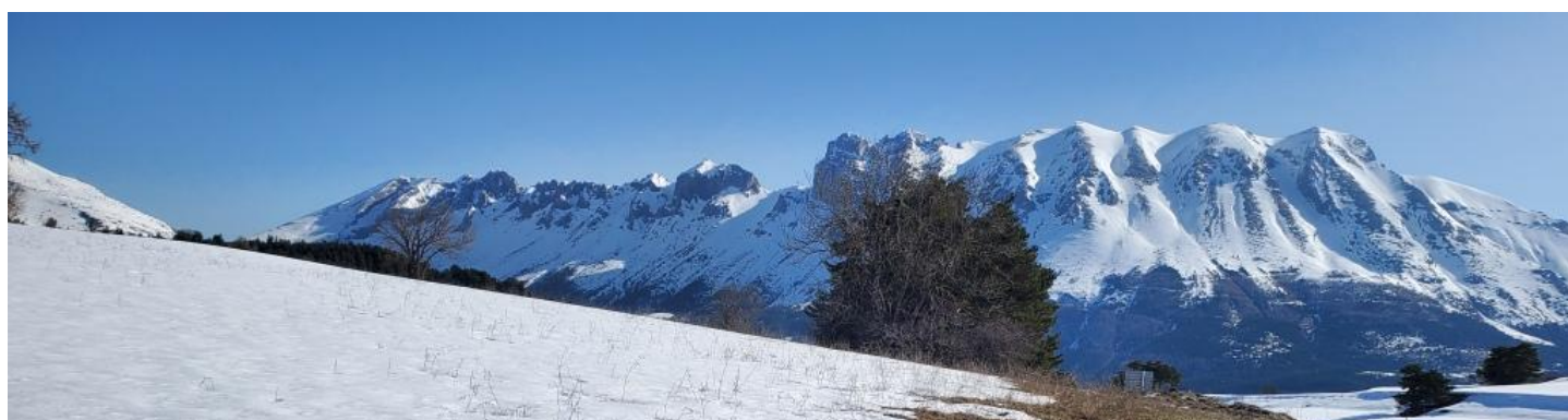
Vue depuis le col de la Joue du Loup :

La montagne de Faraut, frontière entre Vallée du Drac et Souloise – Le Champsaur et Dévoluy