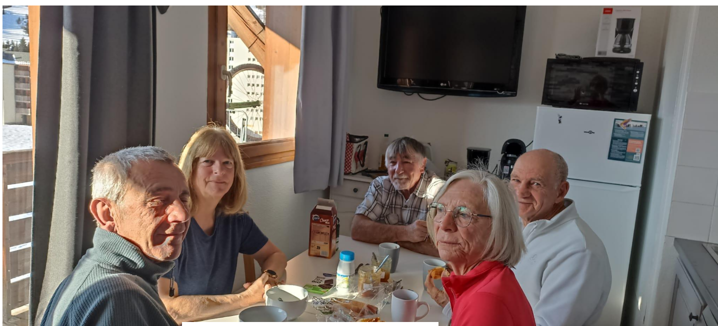
Petit déjeuner, jeudi 19 mars 2026

C'est toujours un plaisir de se retrouver dans le massif du Dévoluy qui ne nous déçoit jamais.