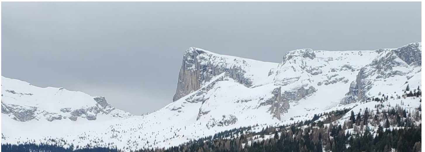
Puis, la montée vers la bergerie et le chalet de l'âne, le mauvais temps nous surprend : vent violent, visibilité réduite, froid intense