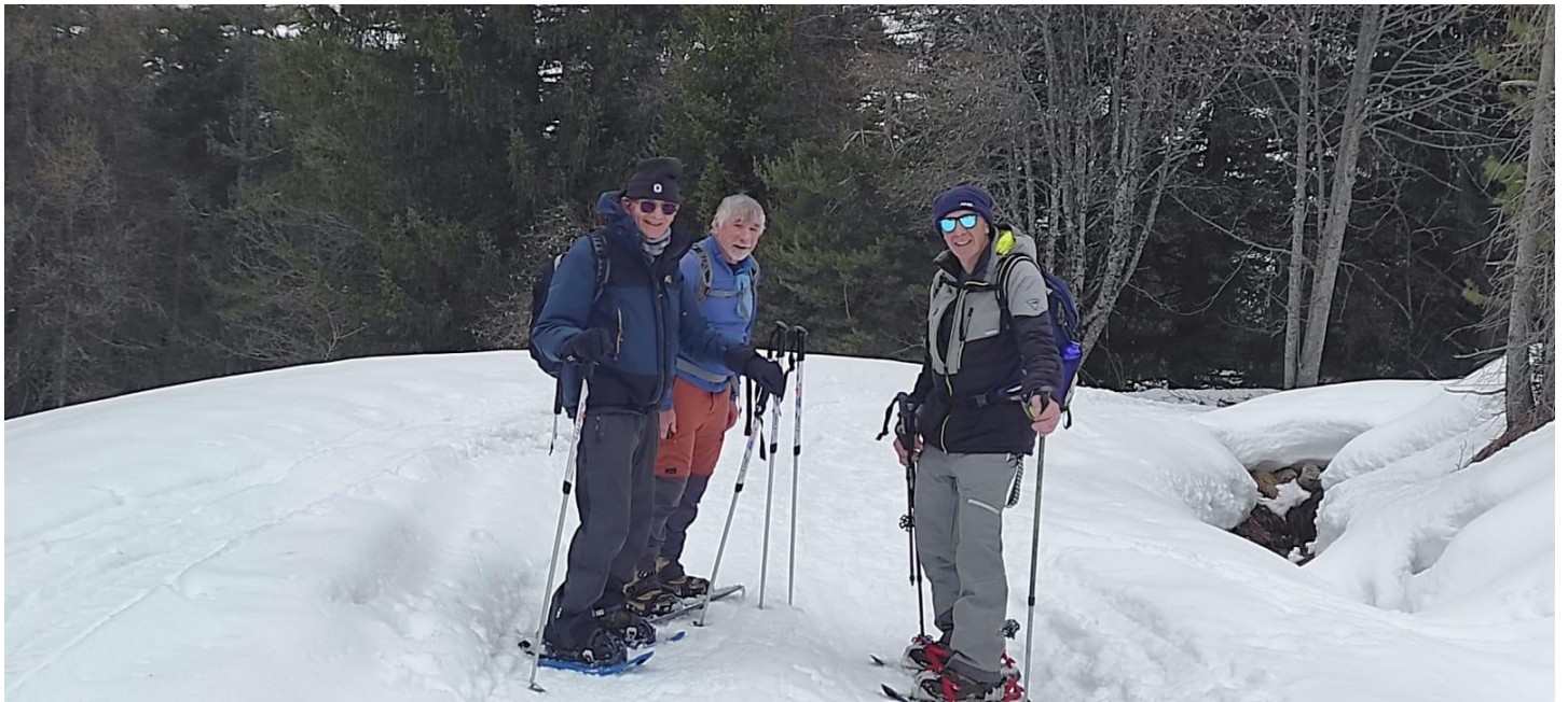
Avant la cabane de l'avalanche c'est le beau temps