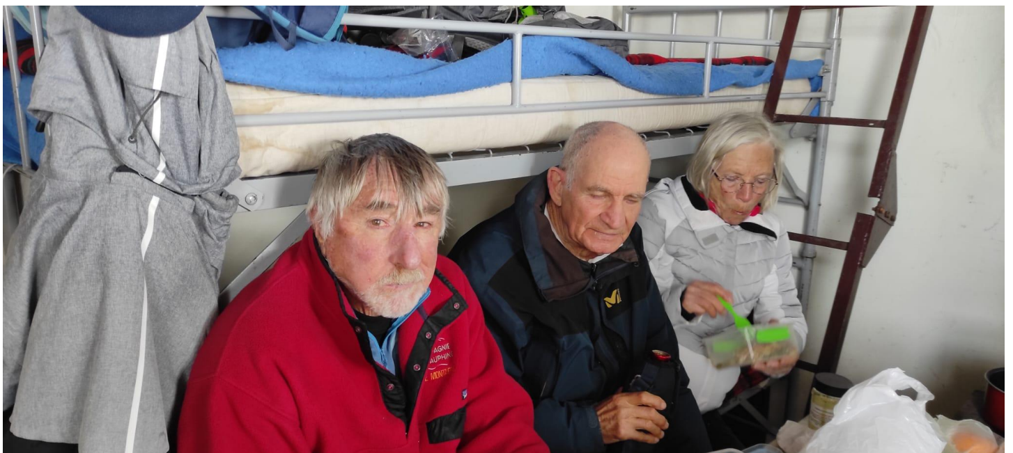
Dans le gîte chalet de l'Âne