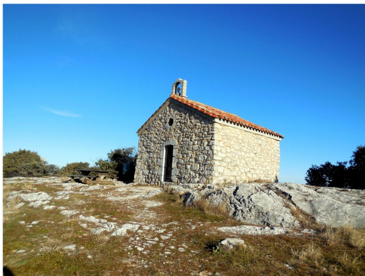
La chapelle de l'Annonciade