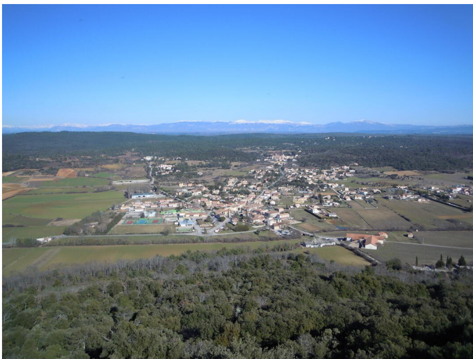
Vue depuis le vieux village sur St Pierre et les hameaux

St Pierre, le hameau le plus important, devient en 1929, le centre administratif de la commune, jusque-là situé au vieux village.