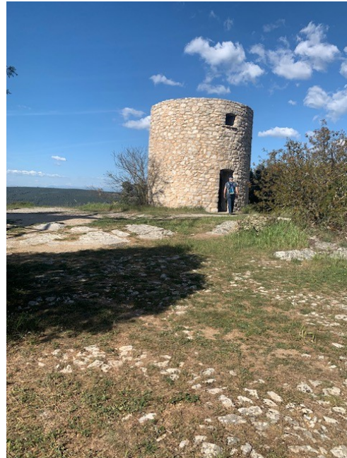
Vestiges d'un moulin