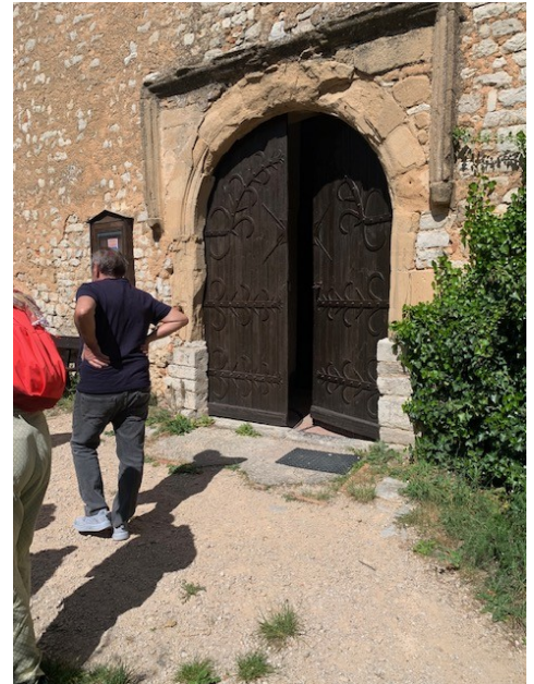
Porte surmontée d'un morceau de cancel du VIème siècle

A l'intérieur, un riche mobilier constitué de tableaux, reliquaires, retables et statues se dévoile mais aussi une peinture contemporaine de l'artiste St Juliennois, Yves CONTE. Vingt quatre objets sont actuellement inscrits au titre des monuments historiques.