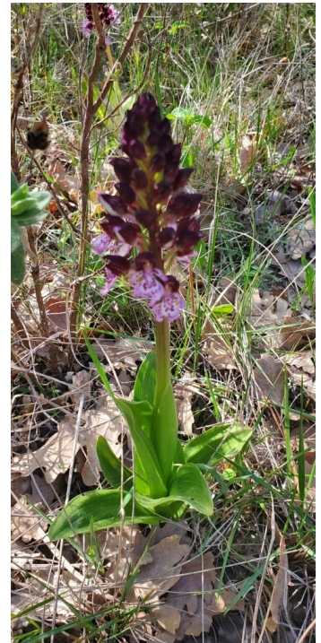
Orchis Casque ( Orchis Purpurea )