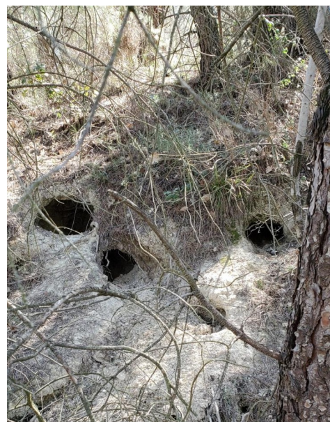
Terriers de blaireaux