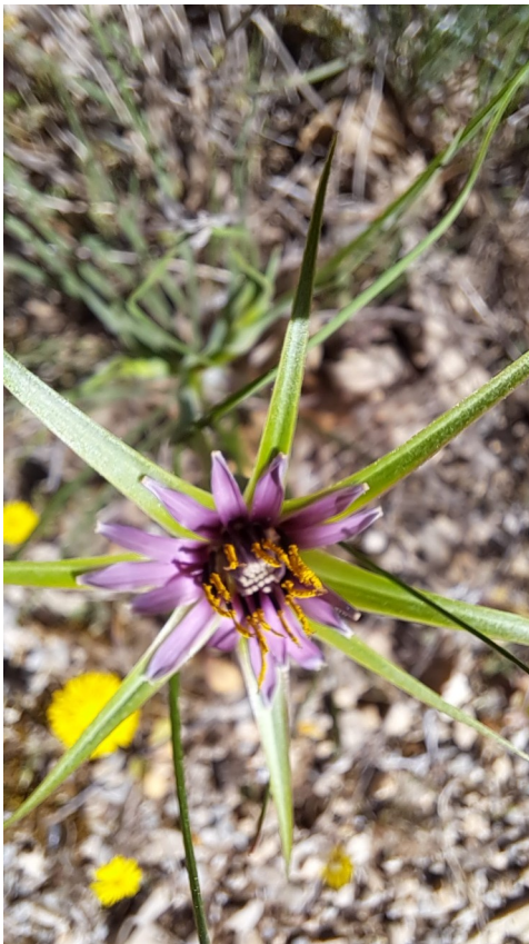
Salsifis austral ou à feuilles de poireaux ( Tragopogon Porrifolius )