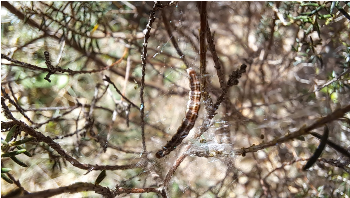
Chenille Papillon (future nacrée?)

En arrivant à la chapelle, située sur l'un des pics de la chaîne de l'Olympe, on bénéficie de la plus belle vue sur la Haute Vallée de l'Arc et de la montagne Ste Victoire. On y trouve l'Emitage, la maison commune, la voute de la chapelle Ste Elisabeth et le clocheton avec sa table d'orientation.