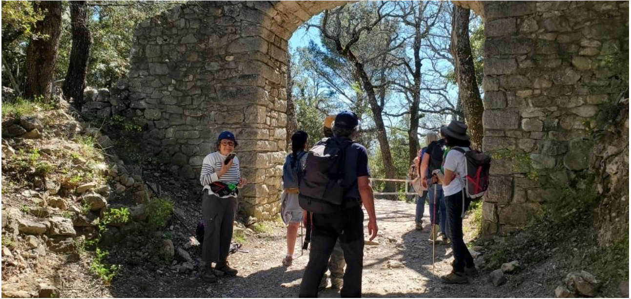
C'est l'heure de la pause « repas » que nous prenons au pied de la chapelle avec un espace aménagé et ombragé.