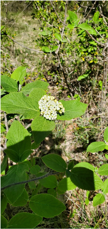
La vierne ( Viburnum Lantana )

Le site de Saint-Jean-du-Puy accueille une biodiversité remarquable.