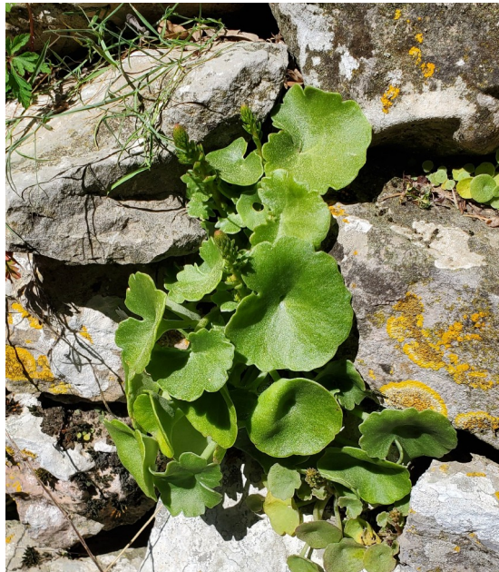
Nombril de Vénus ( Umbilicus Rupestris )