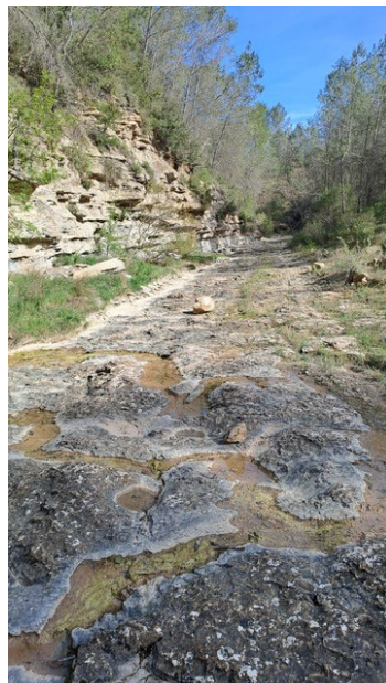
Coquillages Miocène 23 millions d'années