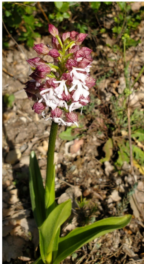
Orchis brûlé ( Orchis Ustulata )