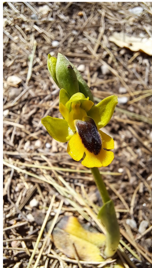
Ophrys jaune ( Ophrys Lutea )