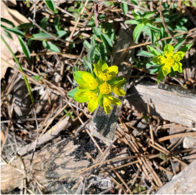
Euphorbe dentée ( Euphorbia serrata )