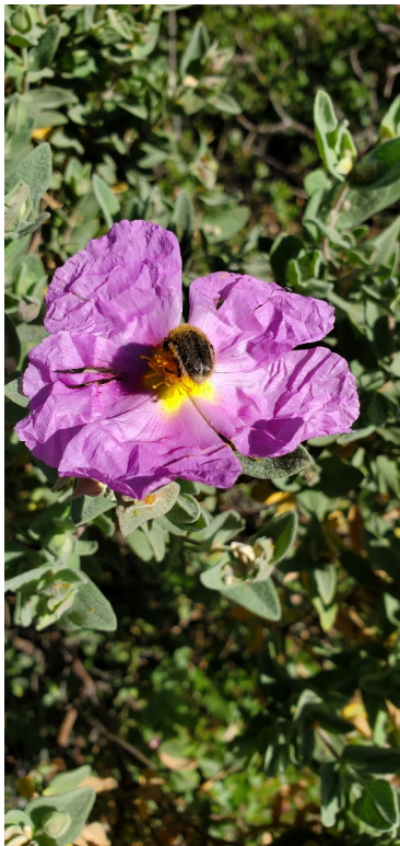
Ciste Cotonneux ( Cistus Albidus )