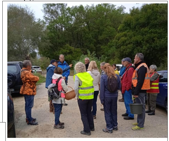
Vue partielle du groupe lors de la passation des consignes.