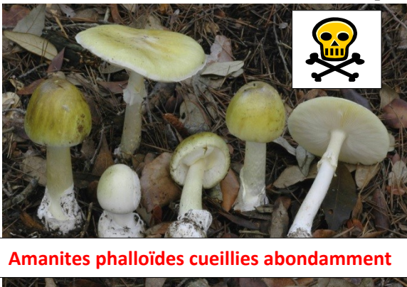
Amanites phalloïdes cueillies abondamment

Rendez vous est donné aux 26 et 27 octobre pour le 21 e Salon du Champignon.