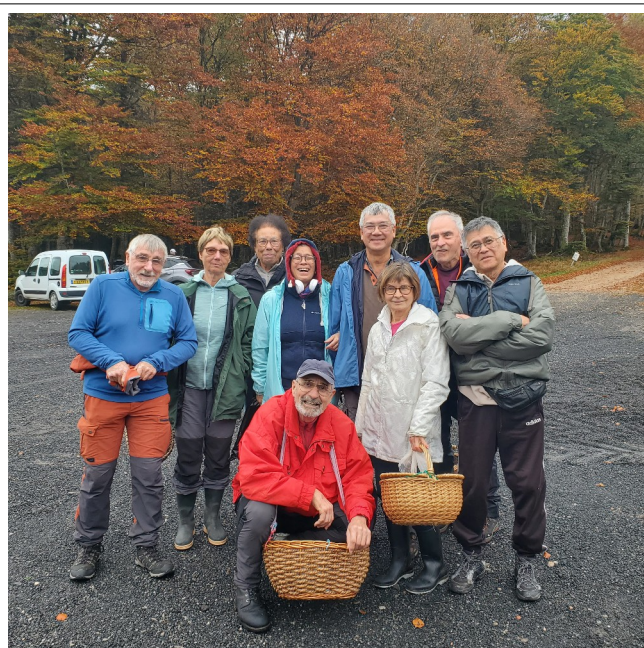
Une partie du groupe devant la hêtraie