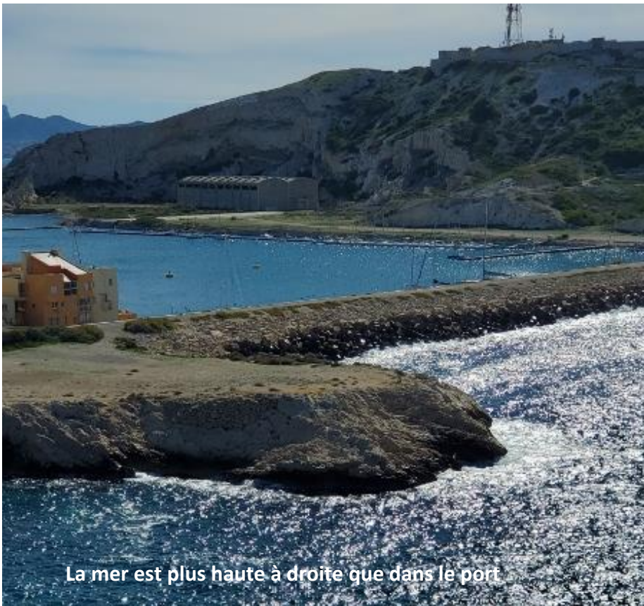
La mer est plus haute à droite que dans le port