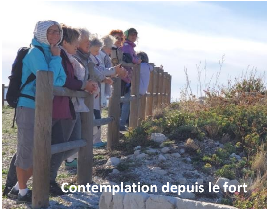
Contemplation depuis le fort