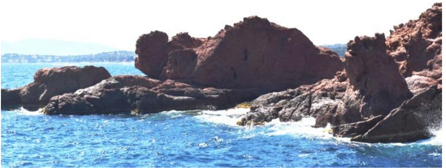
Les lions de mer