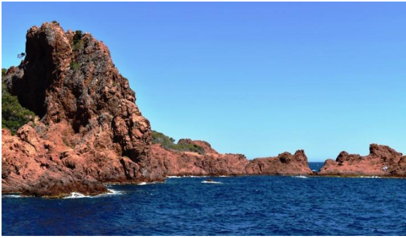
Le cap du Dramont