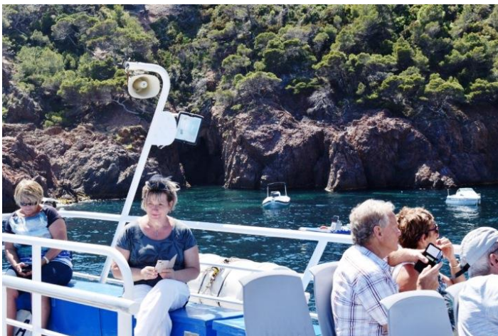
Crique du Dramont