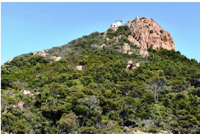
Phare du cap du Dramont