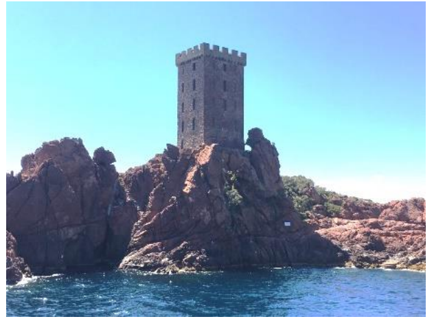
King Kong à l'assaut de la tour