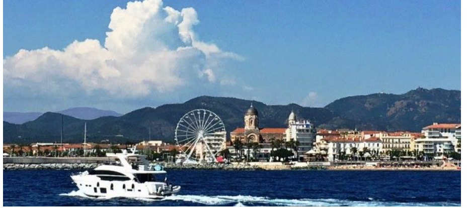
Vue sur la rade