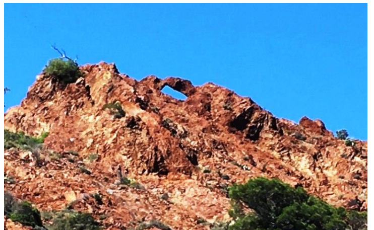
Une arche dans les roches rouges