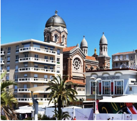
St Raphaël la Cathédrale & le Casino