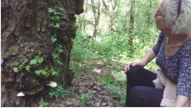
Agrocybe aegerita St Julien

La sortie devait se dérouler dans le Dévoluy, mais le mauvais temps en a décidé autrement. Ici, localement, la saison est trop avancée pour trouver le moindre champignon appartenant à la famille des morilles. Voici par l'image un aperçu de notre super promenade.