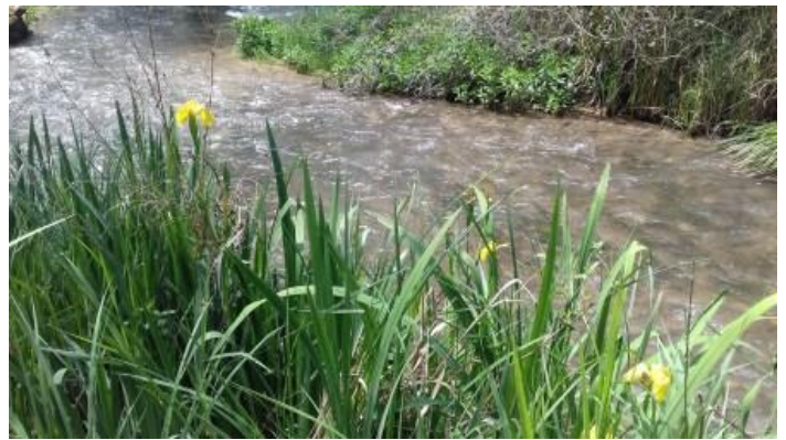
Le Colostre Gréoux