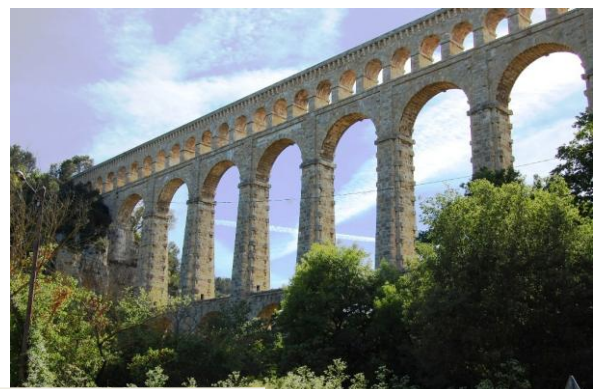
Pilier et vue sur l'aqueduc de Roquefavour