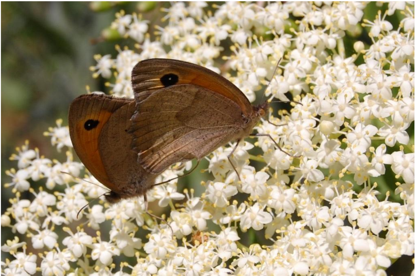
Accouplement de papillons sur fleur de sureau